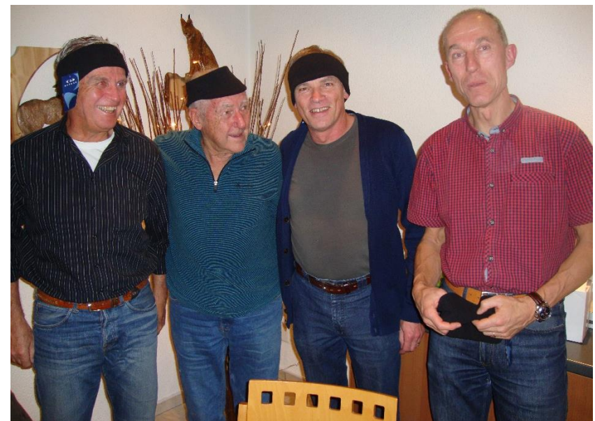
Siegerequipe Schlussturnen 2014