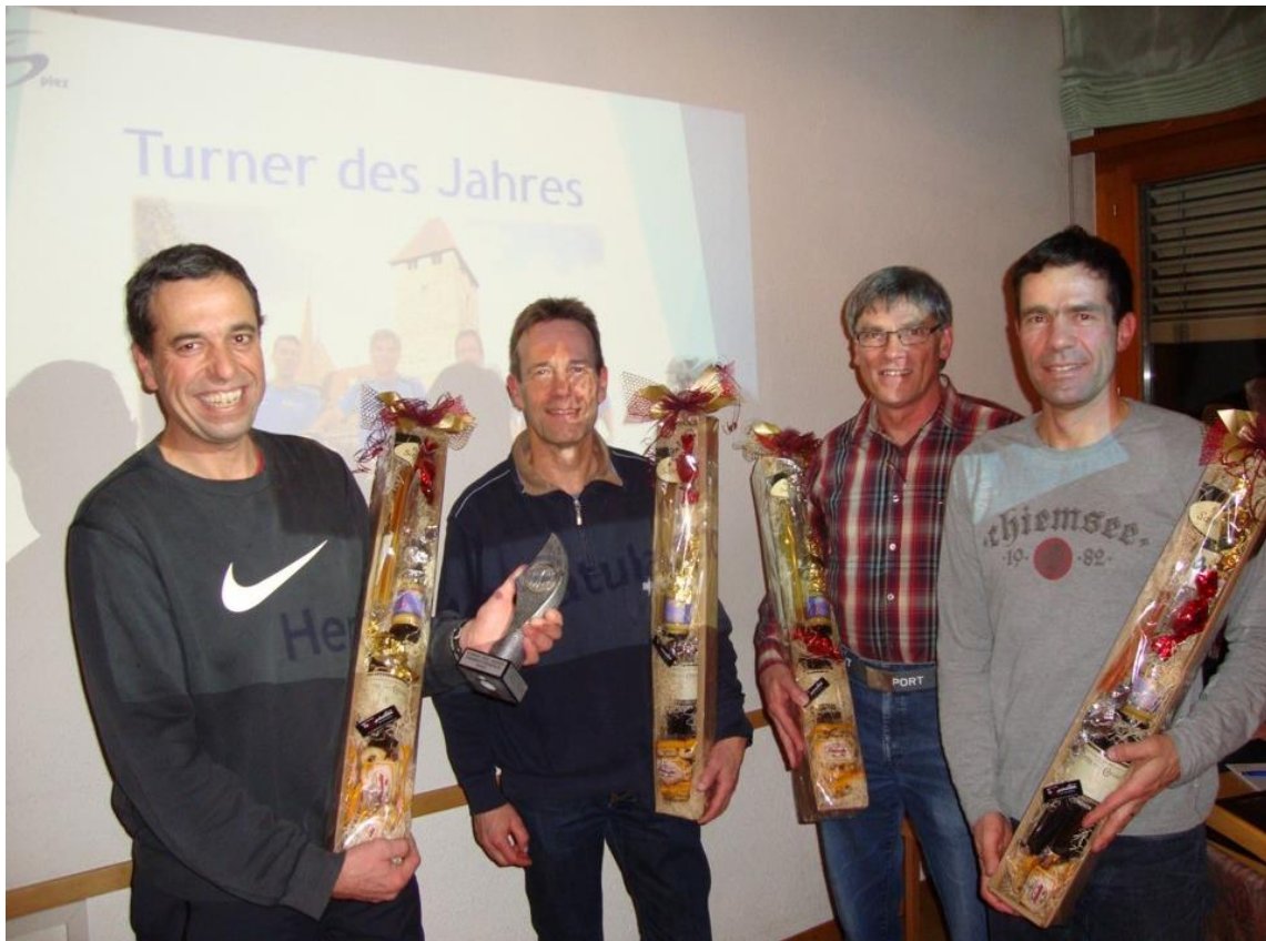
Turner des Jahres