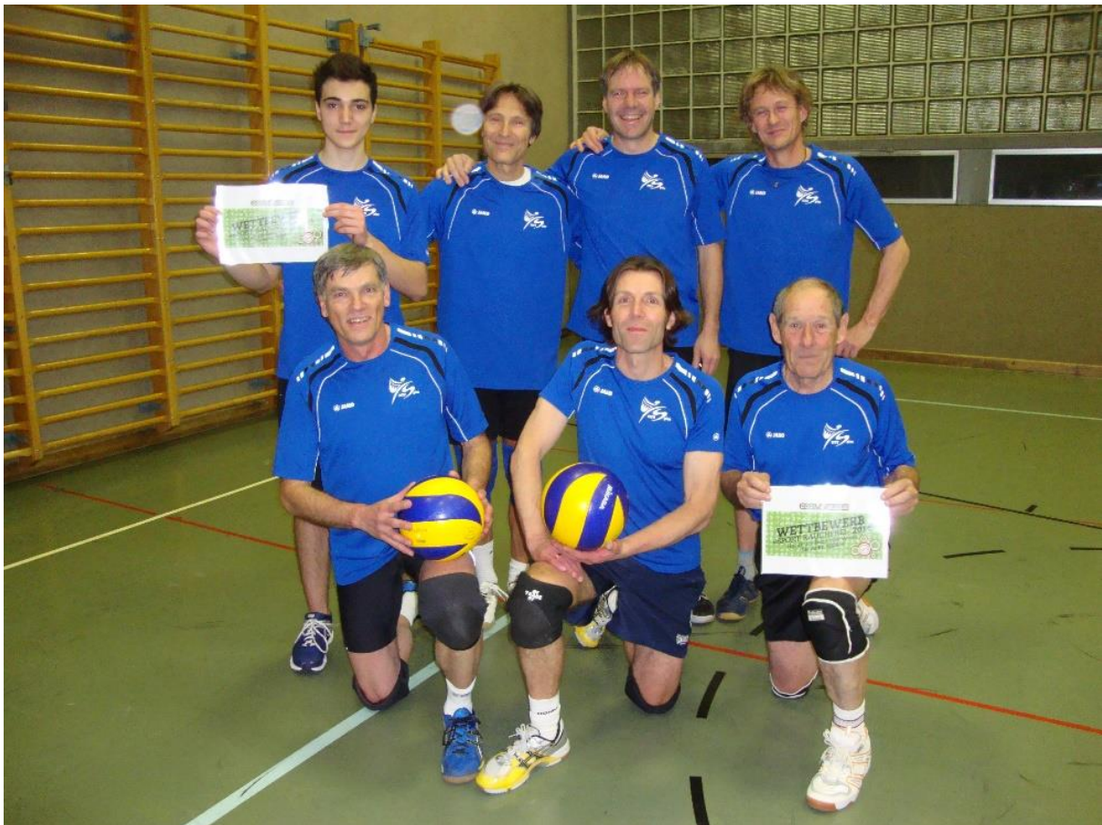
Die Volleyballer nach dem Spiel vom 18.01.2014

Diese Chance liessen sich 33 Vereine und 523 Teams nicht entgehen. Insgesamt haben 6463 Sportlerinnen und Sportler den Ehrenkodex «Sport rauchfrei» unterschrieben und sich damit bereit erklärt, während dem Sportbetrieb drei Vereinbarungen einzuhalten. Für das Team Volleyball des MTV Spiez ist die Rechnung aufgegangen. Es gehört zu den insgesamt 28 Gewinnern.